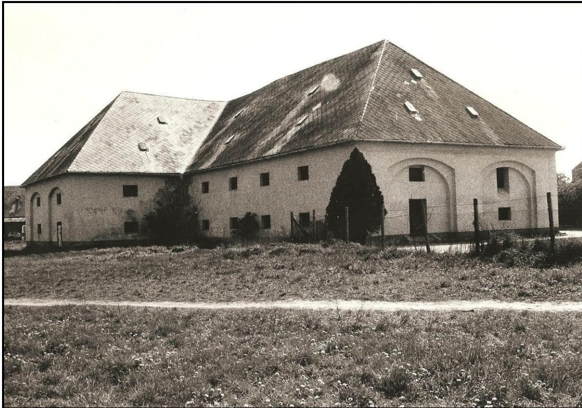
Magtárépület az ezredfordulón