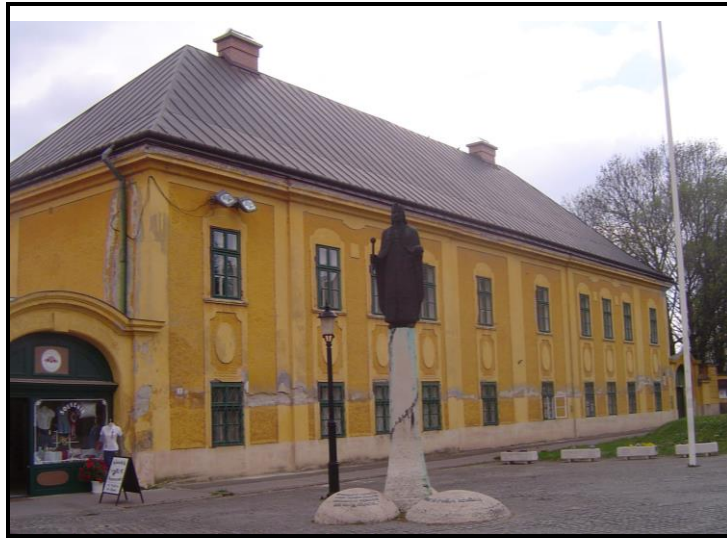
Az épület napjainkban