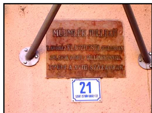
A műemlék tábla