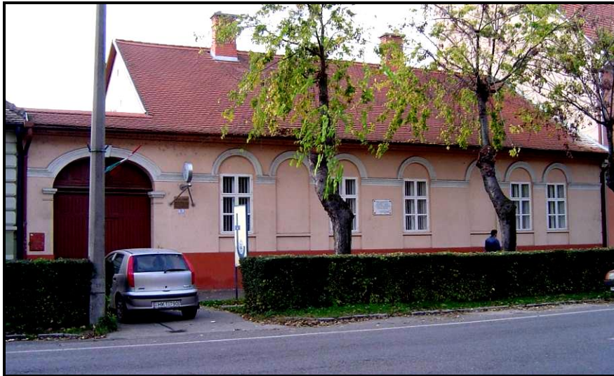
Az épület napjainkban