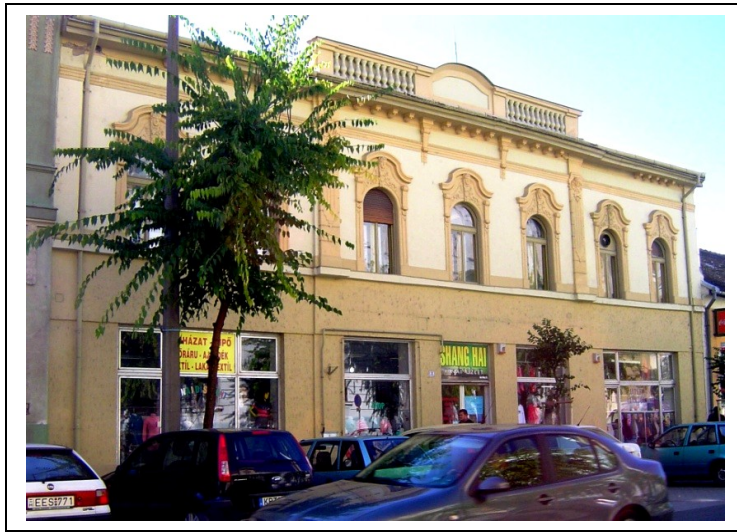
Az épület napjainkban (Fotó Asbóth Miklós 2013)