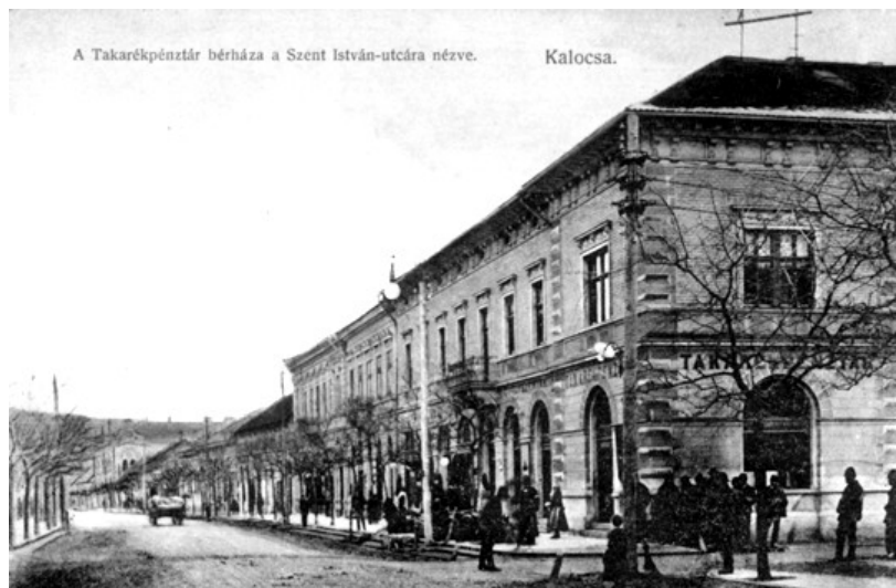
Az épület egy 1910 körüli képeslapon (Asbóth Miklós gyűjteménye)

Egyemeletes eklektikus stílusú U alakú, három utcára néző épület. Építés éve: 1890, építtető: Kalocsai Takarékpénztár Eredeti funkciója: bank, üzlet (földszint), lakás (emelet)