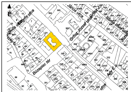
Az épület helyszínrajza (Kalocsa város településszerkezeti terve Örökségvédelmi hatástanulmány. Helyi értékvédelmi topográfia. VÁTI 2004.)