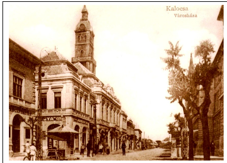
A városháza korabeli képeslapon 1922 után